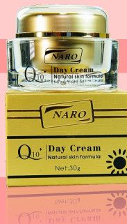
Q10 日霜 30g