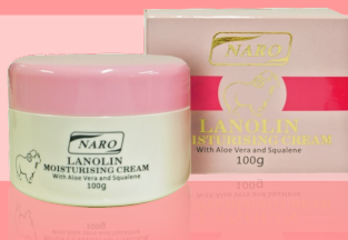
绵羊油超强保湿霜 100g