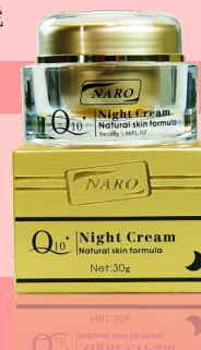
Q10 夜霜 30g