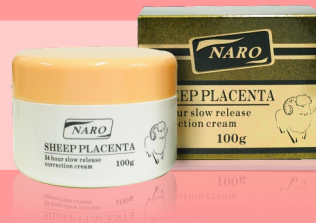
超浓缩羊胎素抗衰老面霜 100g