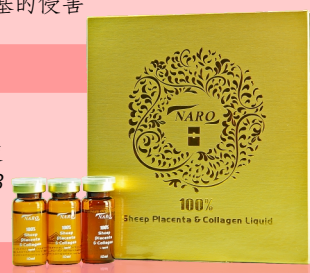
羊胎素胶原蛋白原液 100毫升 x 3