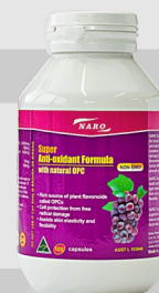
葡萄籽精华 含有OPC24克 + 绿茶成分 60 粒, 100 粒 (4 合 1) 100 粒 (3 合 1),