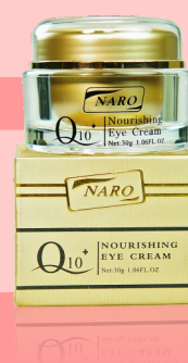
Q10 眼霜 30g