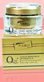
Q10 抗衰老面霜 30g